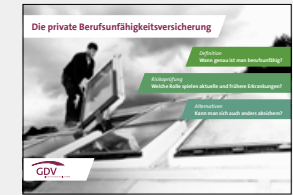
Die private Berufsunfähigkeitsversicherung