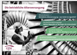
Die betriebliche Altersversorgung