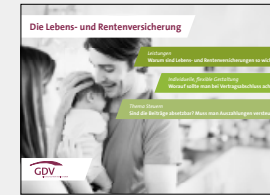
Die Lebens- und Rentenversicherung