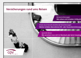
Versicherungen rund ums Reisen