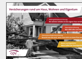
Versicherungen rund um Haus, Wohnen und Eigentum