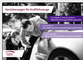
Versicherungen für Kraftfahrzeuge